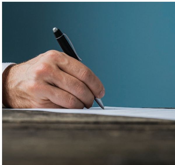
PRATICHE FREQUENTI ANCHE NEI CONTRATTI FRA SOGGETTI PRIVATI

di prestare una cauzione a garanzia degli adempimenti e degli impegni sottoscritti. Essa non è più considerata, come in passato, come dimostrazione di sfiducia di una parte verso l'altra. Le cauzioni possono essere poi costituite con deposito di denaro e valori reali o con fideiussione professionale, in genere bancarie o assicurative. Per ovvi motivi, il deposito di denaro è un sistema poco usato. I diversi tipi di fideiussione e cauzione senza rischi sono ormai frequenti anche nei contratti fra soggetti privati, e servono a garantire gli adempimenti e gli impegni sottoscritti. La Full Insurance Broker ha una particolare specializzazione, avendo mandati in esclusiva, nelle coperture di rischi fideiussori sui mercati internazionali, in favore di aziende italiane che trovandosi all'estero e per ragioni commerciali debbano concedere fideiussione a fornitori, appaltatori, enti pubblici, o in qualsiasi transazione commerciale in Europa o anche fuori dell'unione.