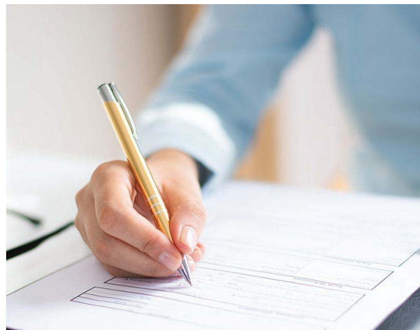
LE CAUZIONI O FIDEIUSSIONI ASSICURATIVE EVITANO L'IMMOBILIZZAZIONE DEL DENARO

La richiesta può avvenire anche per partecipare ad appalti pubblici e per avere varie garanzie